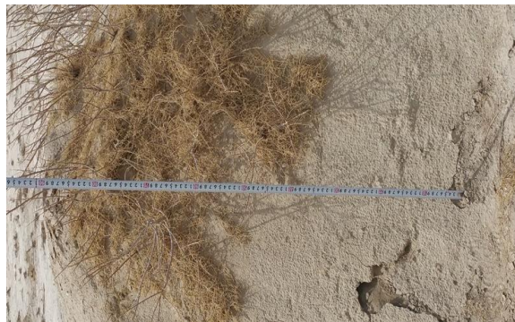
شکل ۲- نمایی از اندازه‌گیری خاک حفاظت‌شده توسط پوشش گیاهی Figure 1. View of a measure of soil protected by vegetation

به‌منظور اجرای این پژوهش، ابتدا برای اندازه‌گیری وضعیت پوشش گیاهی با توجه به نوع پوشش گیاهی ۲ ترانسکت تصادفی به طول ۲۵۰ متر گذاشته شد و در فاصله هر ۵۰ متر از همدیگر پلات‌هایی با توجه به وضعیت پوشش ۳×۳ انداخته شد. همچنین برای اندازه‌گیری درصد تاج پوشش، خاک لخت، تراکم و لاشبرگ از پلات‌های ۱×۱ استفاده شد. گونه غالب نیز در منطقه مشخص و تاج پوشش آن‌ها نیز جهت شناسایی عملکرد حفاظتی آن اندازه‌گیری شد. سه نمونه خاک برداشت و ویژگی‌های بافت خاک (به روش هیدرومتری)، pH در گل اشباع با استفاده از EC .PHmeter در عصاره اشباع (به‌وسیله دستگاه Conductometer) و