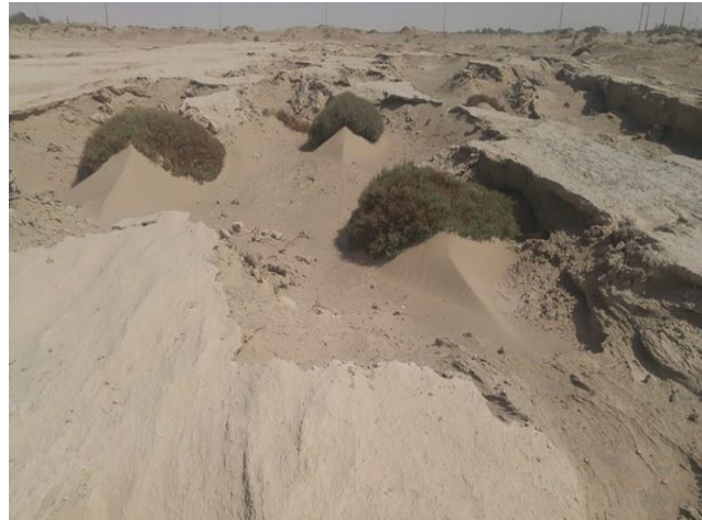
شکل ۳- نمونه‌ای از استقرار گیاه سیاه شور در محدوده‌های فرسایش بادی در منطقه مورد مطالعه