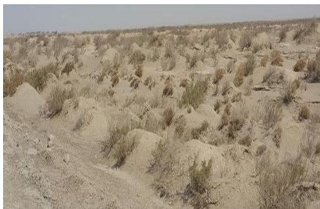
شکل ۴- نمونه‌ای از پوشش گیاهی شمال قرقری Figurer 4. An example of vegetation in the north of Gharghari

پوشش گیاهی و یا وجود پوشش فقیر و غیر متراکم است که این با مطالعات معتمد (۱۹) که عنوان داشته است در جاهای زیادی از نواحی مرطوب دنیا بادهای سهمگینی می‌وزد ولی به دلیل پوشش زیاد خاک محافظت می‌شود ولی در مناطق خشک که سطح خاک حفاظت نمی‌شود فرسایش رخ می‌دهد، مطابقت دارد. در جاهایی که درختچه گز و گونه سیاه شور وجود داشته است خاک به‌خوبی حفاظت و علاوه بر آن به‌عنوان بادشکن نیز عمل نموده و با کاهش سرعت حرکت باد، ماسه بادی نیز در پایین دست آن‌ها ترسیب شده است (شکل ۴).