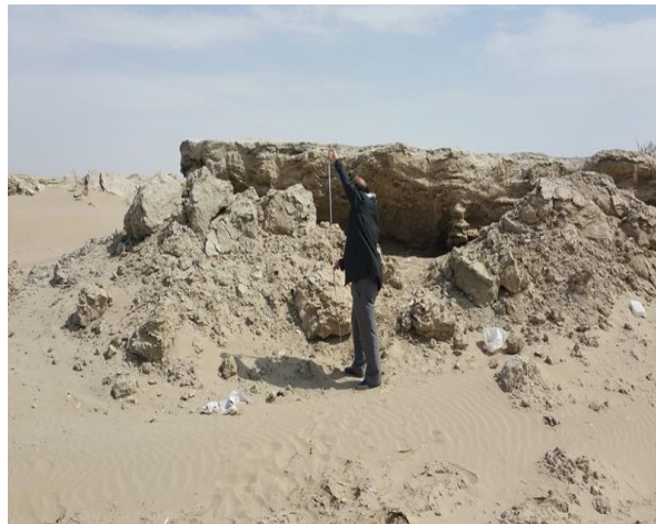
شکل ۴- نمایی از بادکندهای منطقه شمال قرقری