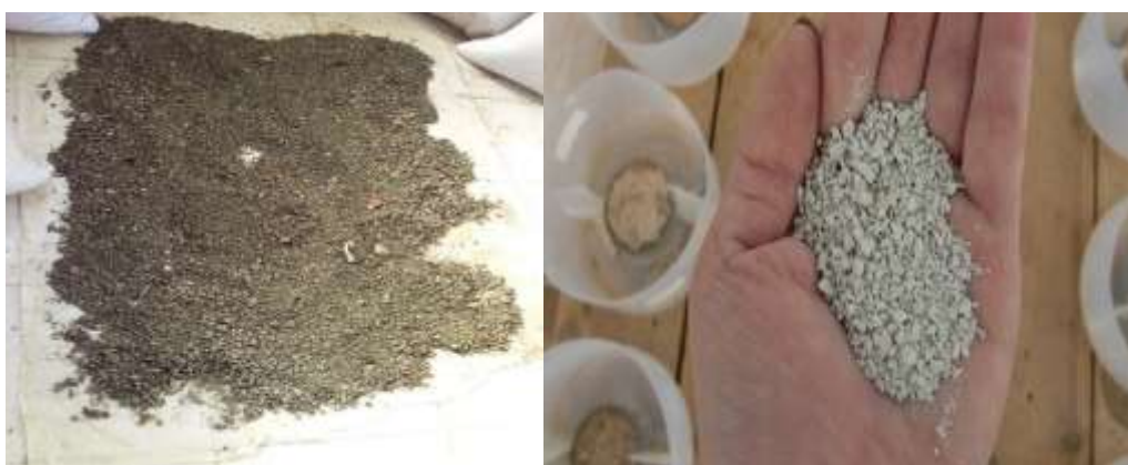
شکل ۱- زئولیت استفاده شده (راست) و کمپوست استفاده شده (چپ) در فنجان‌های پاشمان جهت انجام پژوهش حاضر Figure 1. Used zeolite (right) and compost used (left) in spray cups for the present study

مدت زمانی کمپوست آماده شد. روی فنجان پاشمان به مقدار ۷/۱ گرم (۲۴)، در سه تکرار ریخته شد. در شکل (۱) نشان داده شده است و همچنین ویژگی‌های آن در جدول (۲) ارائه شده است.