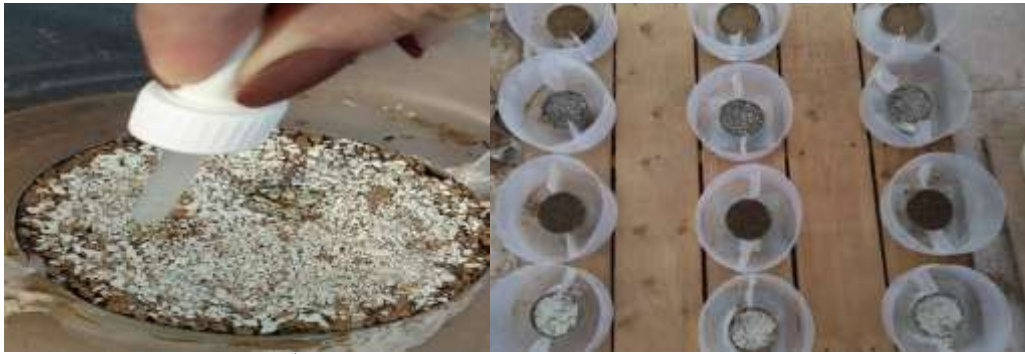
شکل ۲- فنجان‌های پاشمان پر شده با اصلاح‌کننده‌ها و تیمار شاهد (راست) و نحوه اندازه‌گیری آب‌گریزی با استفاده از قطره‌چکان (چپ) Figure 2. Spray cups filled with modifiers and control treatment (right) and how to measure water repellency using a dropper (left)